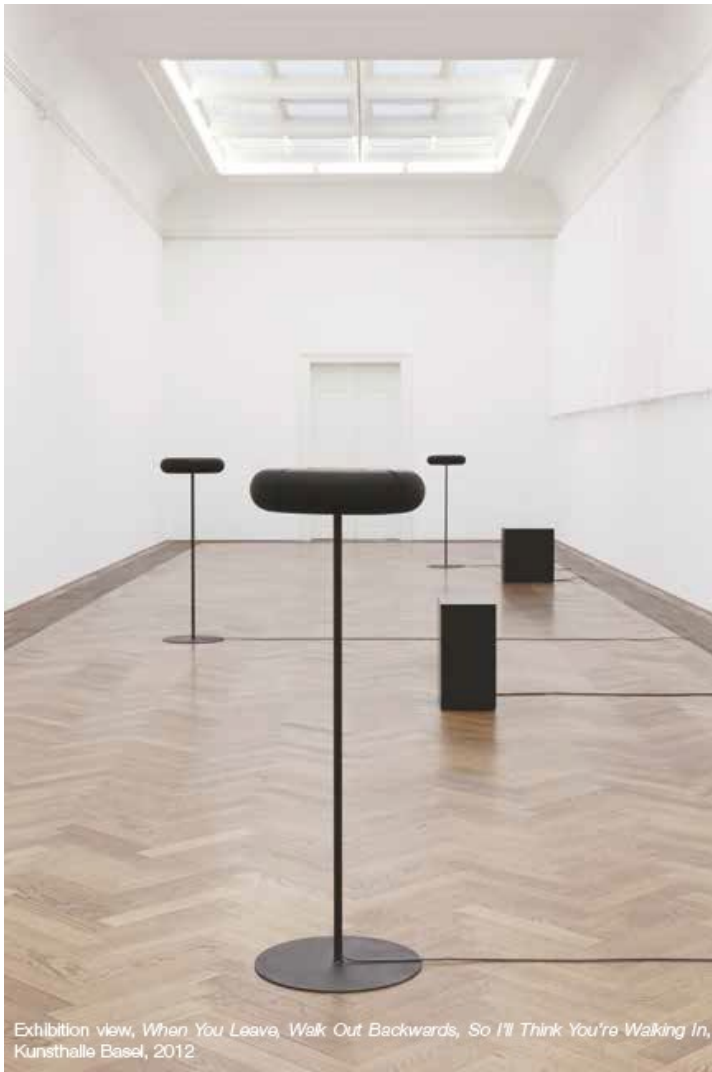
Exhibition view, When You Leave, Walk Out Backwards, So I'll Think You're Walking In, Kunsthalle Basel, 2012