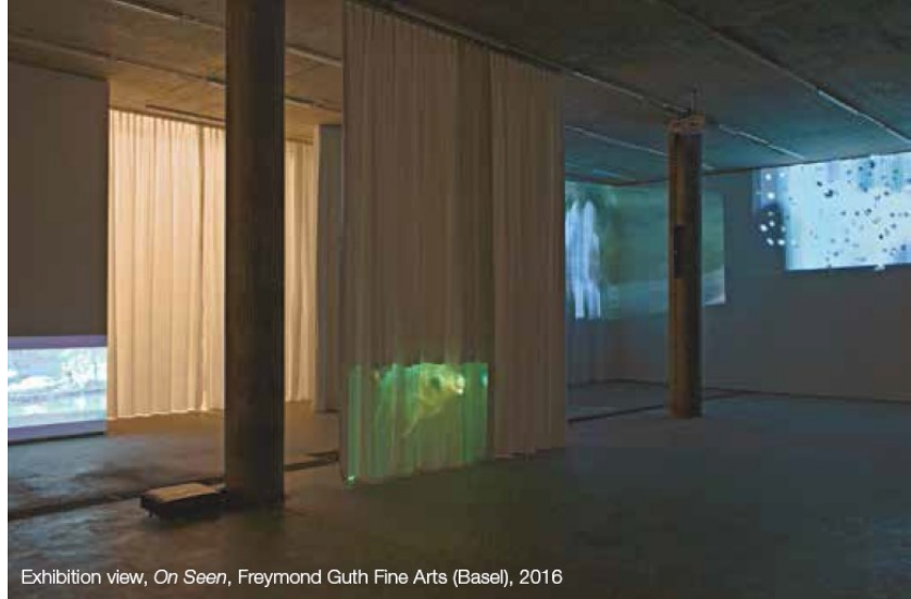
Exhibition view, On Seen, Freymond Guth Fine Arts (Basel), 2016