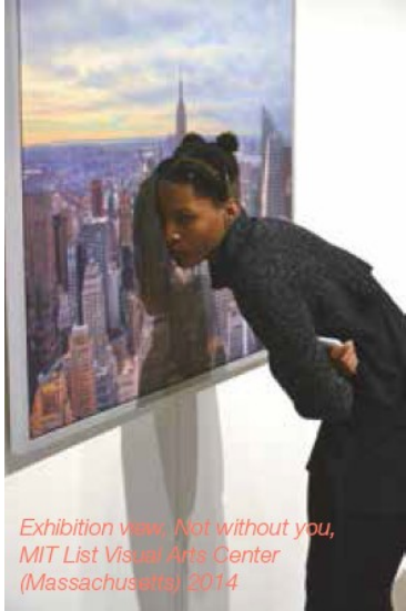
Exhibition view, Not without you, MIT List Visual Arts Center (Massachusetts) 2014