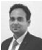
Sriram Chellappa Expert actions